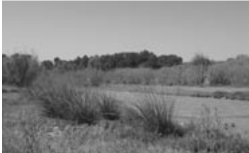
Joan Carles Guix/Ajuntament d'Abrera

FIGURA 10. Entre els anys 2000 i 2003, l'Ajuntament d'Abrera va adquirir dues finques agrícoles situades al marge dret del riu Llobregat: can Morral del Riu (22 ha) i Sant Hilari (20 ha). L'adquisició de les finques es va fer mitjançant dos convenis urbanístics, que es van formalitzar amb la modificació del pla general i que preveien cessions complementàries a les mínimes establertes per la legislació urbanística. Posteriorment, l'Ajuntament va signar un acord de custòdia amb SEO/BirdLife per a la gestió d'aquestes dues finques i del domini públic hidràulic adjacent.