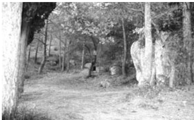
Fundació Josep Carol

FIGURA 9. Durant els anys 1998-2001 es va executar el Projecte LIFE Medi Ambient «Pirineu Viu», promogut i coordinat per l'Agrupació de Defensa Forestal del Mig Pallars, una associació que aplega set municipis i sis entitats municipals descentralitzades i que va vetllar per la bona gestió de les 47 000 ha de boscos comunals de la zona fins l'any 2003. El Projecte LIFE va obtenir molts bons resultats, entre els quals destaquen la creació de 12 reserves forestals gràcies al suport de la Fundació Territori i Paisatge, la senyalització de 21 itineraris forestals i l'apadrinament d'arbres singulars per part de diverses persones, institucions i entitats. Aquest projecte va ser l'embrió del Parc Natural de l'Alt Pirineu, creat l'agost de 2003.