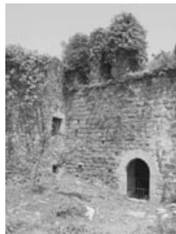
Consortori de les Gavarres

Una entitat local de custòdia és una organització de caràcter públic o privat creada o promoguda per un ens local, de la qual en sol formar part, i que té com a finalitat contribuir a la conservació dels valors naturals i culturals més rellevants del seu àmbit d'actuació (sigui municipal o supramunicipal), mitjançant les tècniques de la custòdia del territori.