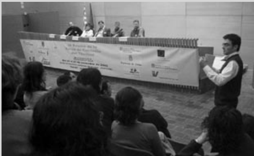
Xarxa de Custòdia del Territori

www.custodiaterritori.org/centrerecursos.php#reunions