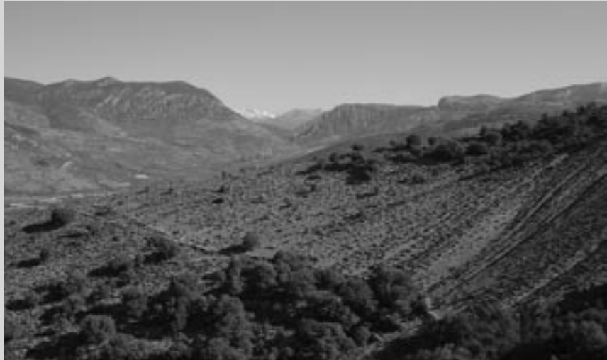
• Josep Angel Alet/Ajuntament de Tremp

• Un primer conveni amb la Fundació Territori i Paisatge va permetre l'any 2001 la redacció d'un pla de gestió de la Terreta. Posteriorment, s'han signat altres convenis de col·laboració que han permès l'execució de diverses actuacions en l'espai gràcies al suport econòmic i tècnic de la Fundació. Les aportacions d'aquesta entitat de custòdia s'han vist afavorides per l'existència d'un equip tècnic a l'Ajuntament, subvencionat pel Departament de Treball de la Generalitat de Catalunya.