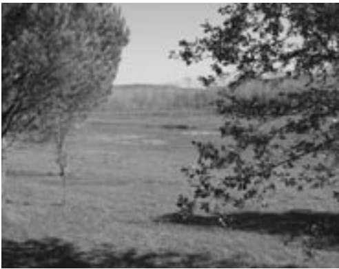
Francesc Ginó/Fundació Natura

FIGURA 19. El corredor litoral del Prat de Llobregat és un espai d'uns 350 m d'amplada i uns 3 km de llargada, situat entre els espais protegits de la Ricarda i el Remolar. Conté algunes de les millors pinedes litorals del delta del Llobregat i fragments d'aiguamolls i vegetació dunar. És propietat d'AENA i, d'acord amb la declaració d'impacte ambiental del projecte d'ampliació de l'aeroport del Prat, s'ha de convertir en un espai dedicat a la conservació, que afavoreixi la connectivitat i permeti un ús públic ordenat. L'espai serà gestionat conjuntament entre AENA i l'Ajuntament del Prat, que ha contribuït en el seu disseny.