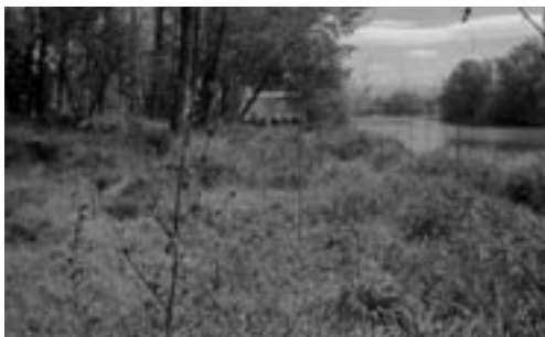
Centre d'Estudis dels Rius Mediterranis

FIGURA 13. El Centre d'Estudis dels Rius Mediterranis, àrea mediambiental del Museu Industrial del Ter ( www.mitmanlleu.org ), té dos acords de custòdia amb l'Ajuntament de Manlleu pels quals el Centre s'encarrega de la gestió de dos espais fluvials que són propietat de l'Ajuntament. Els espais són la platja del Dolcet i el meandre de Gelabert, i des de l'any 2003 s'hi han executat sengles projectes de restauració. Aquests projectes han rebut el suport tècnic i econòmic de diverses entitats públiques i privades, des del mateix Ajuntament (a través de l'Escola Taller Parc del Ter) i l'Agència Catalana de l'Aigua, fins a la Fundació Territori i Paisatge i les empreses La Piara SA i Nupa SA.