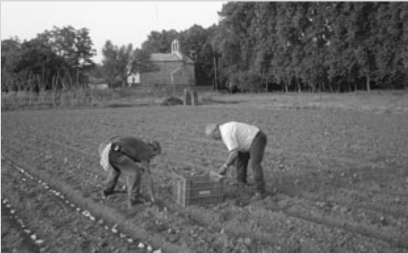
Consorci de l'Espai Rural de Gallecs

Més informació a www.espairuralgallecs.net