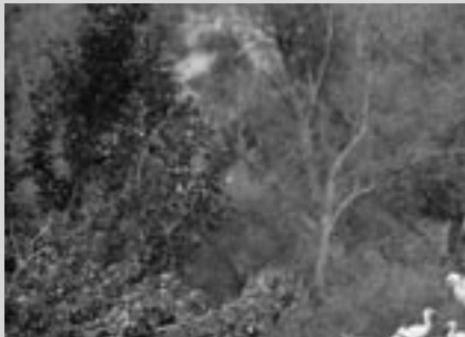
Fundació Territori i Paisatge-Caixa Catalunya

Amb l'objectiu de protegir zones d'interès ecològic o paisatgístic, la Fundació Territori i Paisatge estableix diferents tipus d'acords amb ajuntaments i consorcis, entre els quals destaquen els Convenis d'assessorament