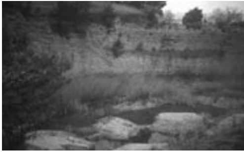
Ajuntament de Vilobí del Penedès

FIGURA 27. La Fundació Territori i Paisatge de Caixa Catalunya presenta cada any una convocatòria d'ajuts per donar suport a projectes ambientals gestionats per entitats sense afany de lucre, ajuntaments i altres ens locals. Les actuacions de custòdia del territori són un dels projectes de conservació previstos per aquesta convocatòria. L'any 2004, per exemple, es va atorgar un ajut a l'Ajuntament de Vilobí del Penedès per conservar els pèlags del municipi, un espai humit d'un gran interès natural i paisatgístic que va sorgir d'unes antigues pedreres.