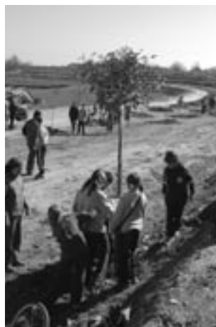
Eduard Portay/ADPN La Banqueta

L'ens local pot crear una entitat o organisme amb personalitat jurídica pròpia i en aquest cas la naturalesa dels acords que assoleixi aquest nou ens dependrà del seu règim jurídic (públic o privat). És