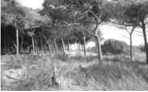
Pau Estebany/Ajuntament del Prat de Llobregat

FIGURA 19. El corredor litoral del Prat de Llobregat és un espai d'uns 350 m d'amplada i uns 3 km de llargada, situat entre els espais protegits de la Ricarda i el Remolar. Conté algunes de les millors pinedes litorals del delta del Llobregat i fragments d'aiguamolls i vegetació dunar. És propietat d'AENA i, d'acord amb la declaració d'impacte ambiental del projecte d'ampliació de l'aeroport del Prat, s'ha de convertir en un espai dedicat a la conservació, que afavoreixi la connectivitat i permeti un ús públic ordenat. L'espai serà gestionat conjuntament entre AENA i l'Ajuntament del Prat, que ha contribuït en el seu disseny.