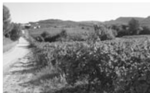
Xavier Sabaté/X3 Estudis Ambientals

En els acords de custòdia, hi intervenen dos agents clars: la