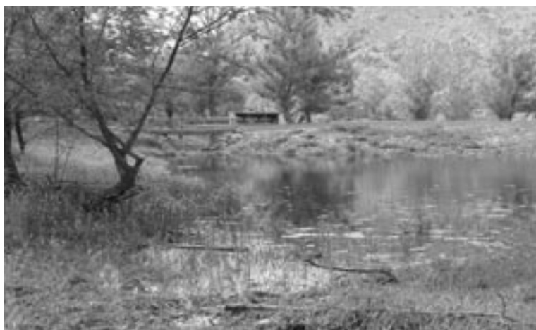
Lutra - Associació Mediambiental

FIGURA 17. Els boscos situats a la riba del Segre dins el municipi de Bellver de Cerdanya són un dels últims romanents de formació boscosa centroeuropea de plana al nostre país. L'Ajuntament va redactar l'any 1998 una proposta d'adquisició d'algunes finques adjacents al riu Segre, que va materialitzar la Fundació Territori i Paisatge. Posteriorment, es va redactar un pla de gestió de l'espai i l'any 2002 es va executar un projecte de restauració del sector de les basses de Gallissà (previ acord entre l'Ajuntament i la propietat), que ha convertit l'indret en un equipament i recurs per a l'educació ambiental. Una entitat del municipi, Lutra - Associació Mediambiental, ha assumit la gestió de l'espai.