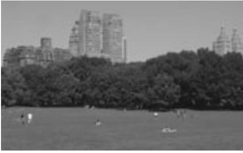
Xavier Sabaté/X3 Estudis Ambientals

FIGURA 6. El Central Park de Nova York, creat l'any 1853 i amb més de 26 000 arbres, rep cada any la visita de més de 25 milions de persones i de quasi 300 espècies d'ocells migratoris. Aquest gran parc urbà va patir una greu degradació durant els anys 70, fins que l'any 1979 es va crear The Central Park Conservancy ( www.centralparknyc.org ), una entitat de custòdia que va impulsar campanyes de voluntariat i de recaptació de fons econòmics entre la ciutadania. Actualment, el servei de parcs de la ciutat i l'entitat treballen segons un acord signat l'any 1998. L'entitat aporta dues tercers parts del pressupost del parc.