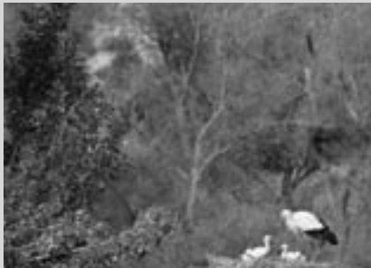
Fundació Territori i Paisatge-Caixa Catalunya