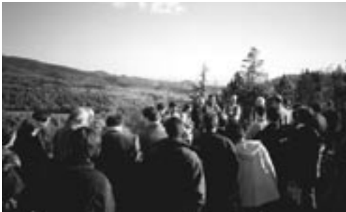
Xarxa de Custòdia del Territori

Els ens locals, en l'establiment de les quotes que cal exigir per a qualsevol taxa, poden tenir en compte tant les característiques del subjecte passiu com les de la mateixa naturalesa de la prestació. En aquest segon cas, la prestació es podria vincular a la custòdia del territori. Els preus públics són aquella contraprestació que un ens local pot exigir per la realització d'activitats o prestació de serveis de la seva competència que no es puguin finançar mitjançant taxes. Si bé els preus públics han de cobrir el cost del servei o l'activitat, la legislació permet que quan hi hagi raons socials, benèfiques, culturals o d'interès públic, es fixin preus públics que no cobreixin íntegrament aquest cost.