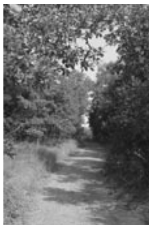
Ajuntament de Granollers

FIGURA 17. Els boscos situats a la riba del Segre dins el municipi de Bellver de Cerdanya són un dels últims romanents de formació boscosa centroeuropea de plana al nostre país. L'Ajuntament va redactar l'any 1998 una proposta d'adquisició d'algunes finques adjacents al riu Segre, que va materialitzar la Fundació Territori i Paisatge. Posteriorment, es va redactar un pla de gestió de l'espai i l'any 2002 es va executar un projecte de restauració del sector de les basses de Gallissà (previ acord entre l'Ajuntament i la propietat), que ha convertit l'indret en un equipament i recurs per a l'educació ambiental. Una entitat del municipi, Lutra - Associació Mediambiental, ha assumit la gestió de l'espai.