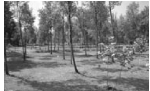
Marc Francolí/Fundació Emys

És possible que un ens local hagi obtingut, gràcies a les cessions