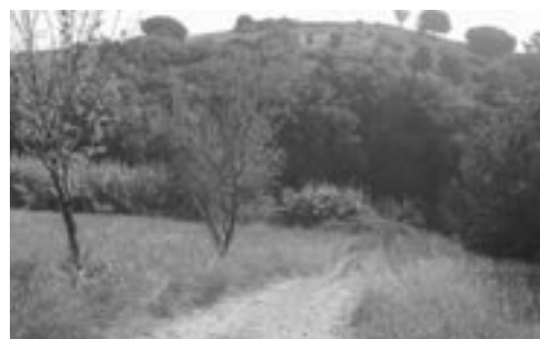
Ajuntament de Granollers

Les entitats de custòdia, però també moltes altres entitats cíviques de l'àmbit local (centres excursionistes, societats de caçadors, entitats veïnals, etc.) poden integrar-se en aquest òrgan de participació. Així es va fer, per exemple, en les Normes subsidiàries de Cassà de la Selva, que preveien la creació d'un consell de custòdia del territori que es va constituir posteriorment.